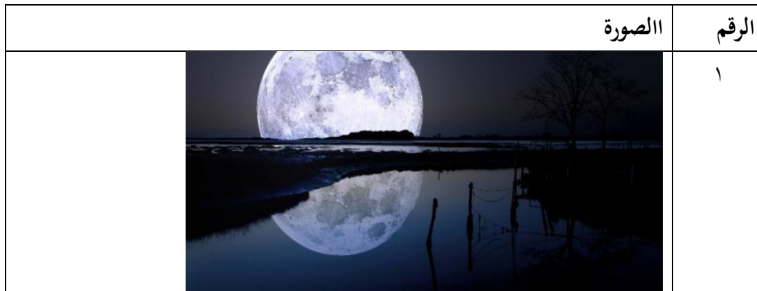
الجدول ٤. جداول المفردات للتدريبات اللغوية

صف الصور التالية أمام الفصل! (وأدخل المفردات في الجدول في الوصف)