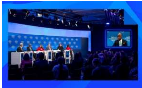
الصورة التوضيحية للمنتدى الاقتصادي العالمي

وبعد الإتيان بالتعريف يمكن للمعلم عرض الصور المتعلقة بالمصطلح لتعزيز فهم المتعلم، ومثاله هو: